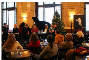
Sajtótájékoztató Lajkó Félix részvételével

A 2015-ös éve Lajkó Félix újévi szólókoncertjével indult 2015. január 3-án. A koncert bevételével a művész az Alapítvány betegellátási tevékenységét támogatta. A teltházas esemény nagy médiavisszhangot is kiváltott. Számos rádióadó, nyomtatott és internetes újság is foglalkozott az eseménnyel, ami egyben azt is jelenti, hogy a közvetlen pénzbevételén túl az ismertségünk növekedése is fontos hozadéka a művész által lehetővé tett nyilvános eseménynek.