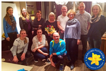
A Nárcisz Futókör találkozójának résztvevői, 2015. március 20.

A Nárcisz Futókör a Magyar Hospice Alapítvány jószolgálati futóközössége. 2015-ös rendezvényinek sorát az I. Nárcisz Futókör találkozót nyitotta meg, 2015. március 20-án.