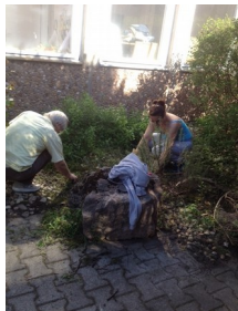
Kerti munka 2015. április 15-én a Budapest Hospice Házban

Önkéntesek segítették munkánkat számos rendezvény hatékony lebonyolításában : az Óbudai Civil Napokon, a Viviccita Városvédő futáson, a Spar Budapest Maratonon fontos volt az önkéntesek ott végzett munkája. De az önkéntesek azok, akik mozgósíthatók alkalmi segítségkérésekkel is: recepciós munkatársunkat betegsége idején önkéntesek egymást váltva helyettesítették; karácsonyi ünnepségünkön egyes betegeink csak az ő segítségükkel tudtak részt venni, mert másképpen mint önkéntes segítővel nem tudtak volna eljutni a Budapest Hospice Házba.