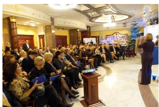
A Kúria dísztermében 2015. december 12-én

2015 során a Magyar Hospice Alapítványt a Kúria, a Budapest Környéki Törvényszék és a Magyar Bírói Egyesület levélben kereste meg Alapítványunk igazgatóját azzal, hogy hagyományos, közösen megrendezett adventi jótékonysági eseményeik bevételével a Magyar Hospice Alapítványt és betegeit kívánják támogatni.